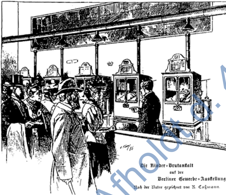
Die Kinder-Brutankalt auf der Berliner Gewerbe-Ausstellung Mit der Natur gezeichnet von N. Cohnmann.

Kuvöspaviljongen på världsutställningen i Berlin 1896 blev en stor succé och utställningens verkliga dragplåster. Nära 5 miljoner besökare beräknas ha beskådat prematurerna.