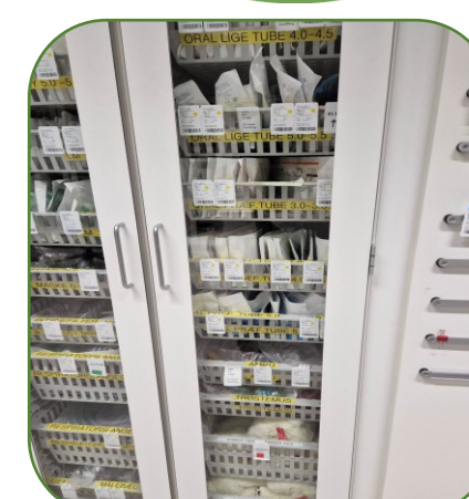
Når du tager ting i skabe og skuffer