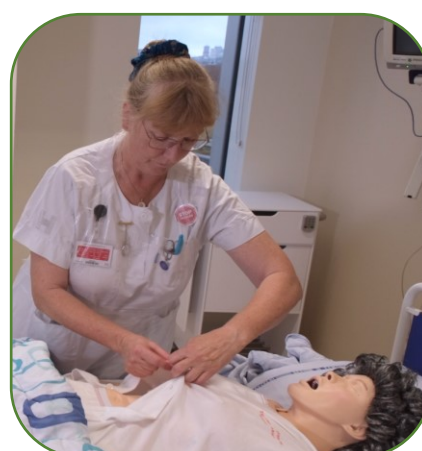
Plejeopgaver og forflytninger uden kontakt med humanbiologisk materiale